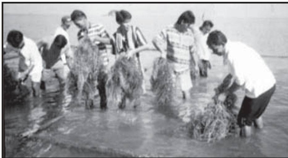
Ang mga Palaweño habang nag-aani ng “seaweeds”

Ginagamit din ito bilang bahagi sa paggawa ng mga kosmetiko, gamot at produktong farmasyutikal. Ang katas nito ay ginagamit na additives sa paglalata ng pagkain, pakain