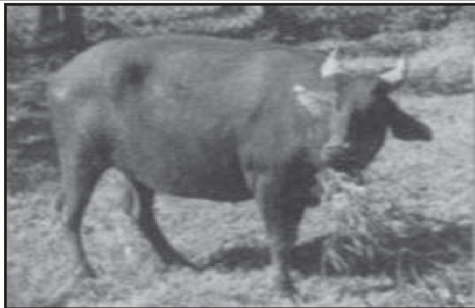
Ang "Tamaraw" isa sa namumukod tanging uri ng hayop na matatagpuan lamang sa lalawigan ng Occidental Mindoro

Maraming mineral ang matatagpuan dito tulad ng limestone, guano, chromite, Mindoro jade, quartz, tale, at asbestos.