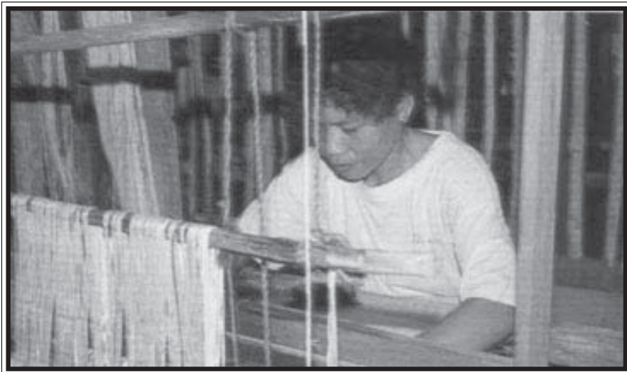
Kabilang sa small & medium industries na pinaunlad sa Marinduque ang paggawa ng basket at hand loom-woven products gaya ng nasa larawan.