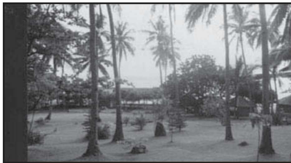
Pangunahing produkto ding maituturing sa Romblon bukod sa "marble" ay ang "kopra" mula sa puno ng niyog gaya ng makikita sa larawan.

Maari ring paunlarin ang wholesale trading, pabrikasyon ng mga metal, pasilidad sa cold storage, distribusyon ng mga produktong mula sa langis, vehicle repair shops at warehouse facilities.