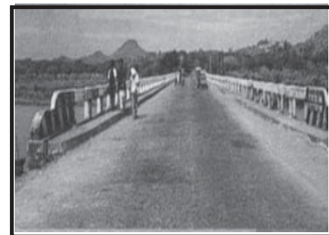
Ang tulay at daan na siyang nagpapabilis sa pagkilos ng mga tao at ng pagluluwas ng mga produktong nanggagaling sa iba't ibang panig ng lalawigan.

Marami pang maihahandog ang lalawigan kaya't halinang mamasyal sa mayamang lalawigan ng Occidental Mindoro.