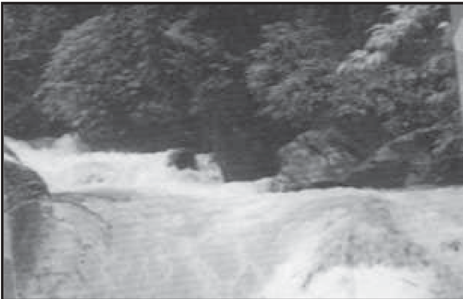
Ang malamig at malinis na springwater ng Calawagan Mountain Resort na ipinagamamalagi ng bayan ng Paluan.

Umabot naman sa 34.8 porsiyento ang kabuuang kita sa pagnenegosyo sa wholesale at retail, samantalang mga 10 porsiyento naman ang kabuuang pagnenegosyo sa lalawigan.