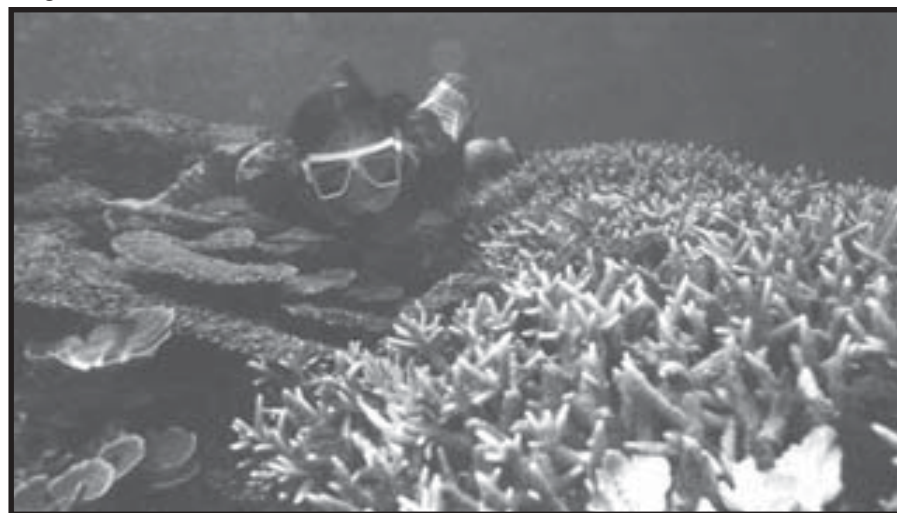
Ang Napsan Coral Garden sa Puerto Princesa, Palawan

Malaking tulong sa mga Palaweño ang malawak at masaganang dagat dito para sa pag-unlad na pangkabuhayan. Ang pagpaparami ng produksyon ng halamang dagat na ito at pagkultura ng iba’t ibang kagamitan, pagkakaroon ng pagkakakitaan at pagkakaroon ng mga mamumuhunan mula sa mga rural na pook. Kaya nga kailangang pangalagaan ang ating karagatan. Malaking tungkulin itong nakaatang hindi lamang sa ating pamahalaan lalo’t higit sa lahat ng mga mamamayang ang pinagkukunan ng ikinabubuhay ay mula sa karagatan.