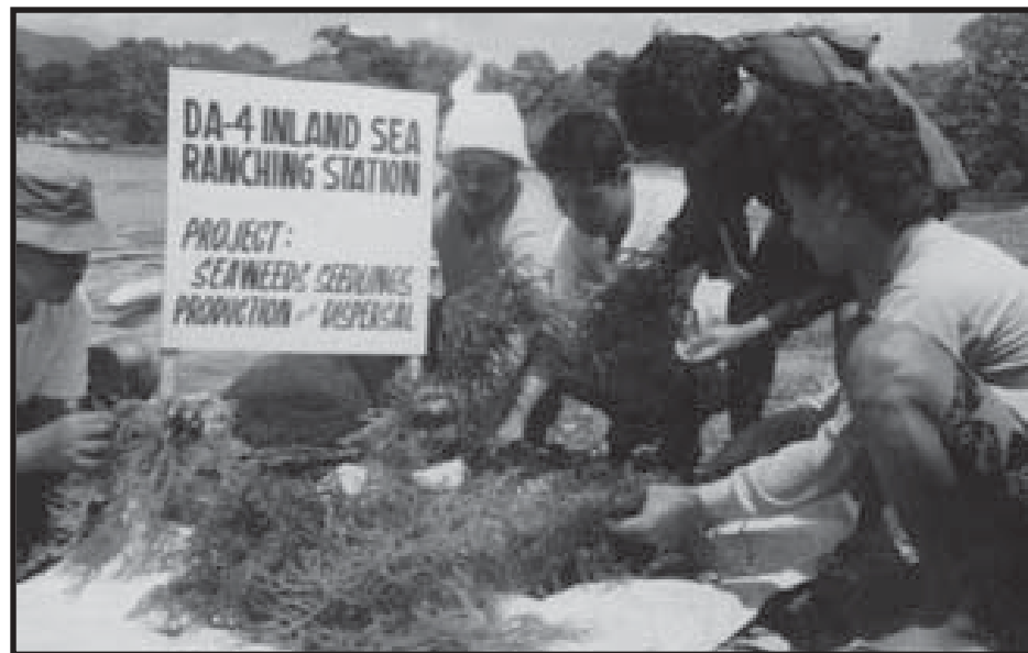
Ang mga Palaweño habang inaayos ang inaning “seaweeds”